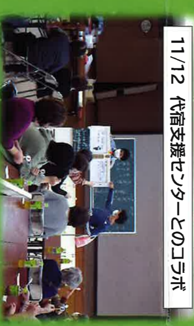
11/12 代宿支援センターとのコラボ