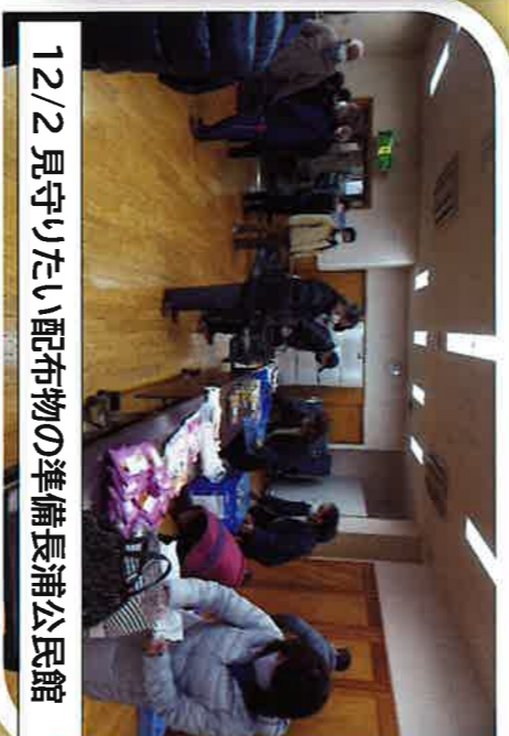
12/2見守りたい配布物の準備長浦公民館