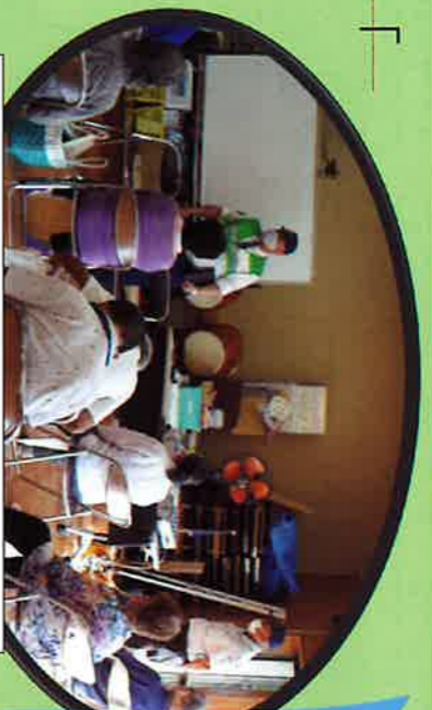
10/4長浦サロン、交通と防犯の話

社協便りの読者の皆さん、こんにちは 昨年10月以降の活動を写真にして、活動の一部を掲載しました。なごやか交流会、見守り訪問関係、サロン関係、代宿支援センター、地域福祉フェスタ、バスハイク、研修旅行、恵方巻作り、防災訓練参加等です。ご協力いただいた猪狩先生、木更津警察署、市役所、代宿支援センターの方々、その他ご尽力いただいた方々、スタッフの皆さん、ありがとうございました。