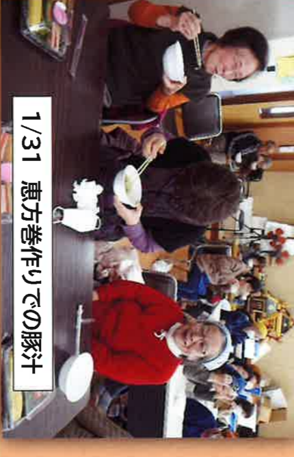
1/31 恵方巻作りでの豚汁