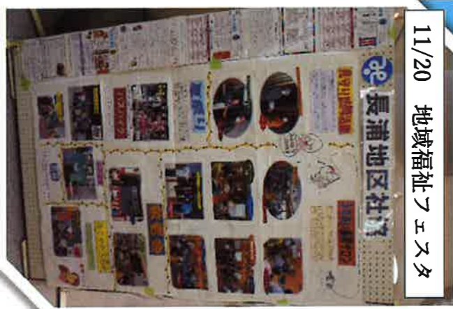
11/20 地域福祉フェスタ