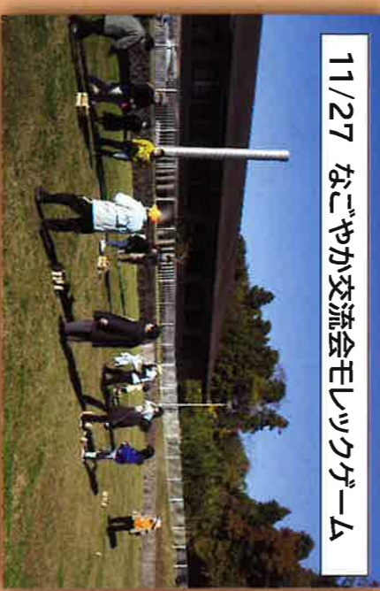
11/27 なごやか交流会モリツクゲーム