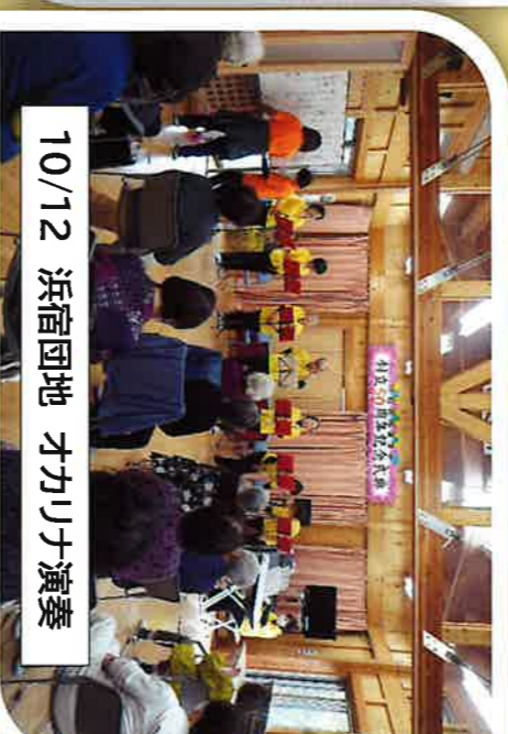
10/12 浜宿団地 オカリナ演奏