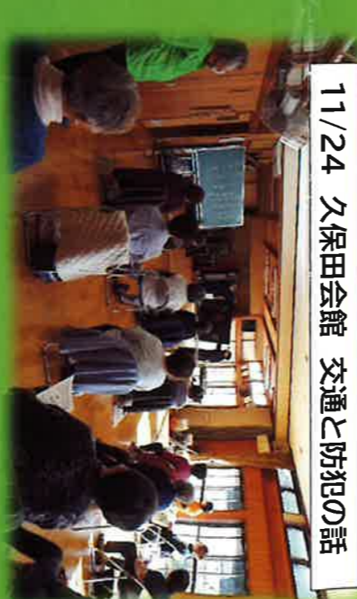
11/24 久保田会館 交通と防犯の話