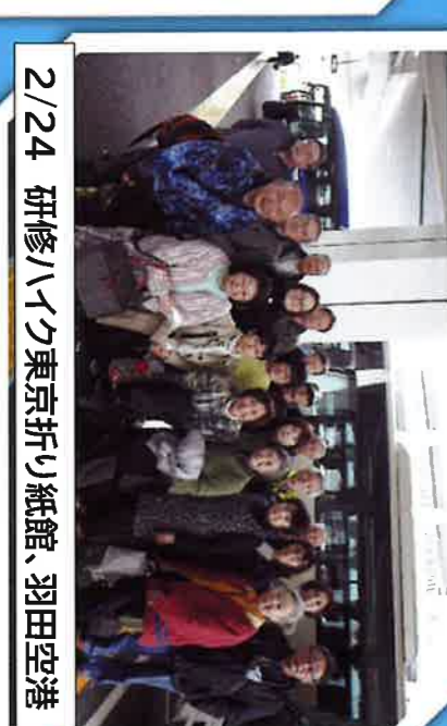
2/24 研修ハイク東京折り紙館、羽田空港