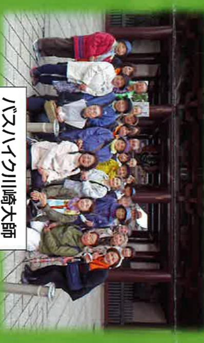
バスハイク川崎大師