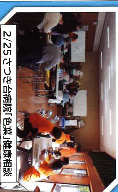
2/25 さつき台病院「色葉」健康相談