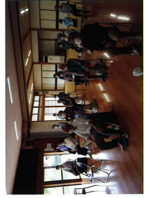
令和3年6月1日長浦駅前自治会館 包括支援センター 体操と健康の話