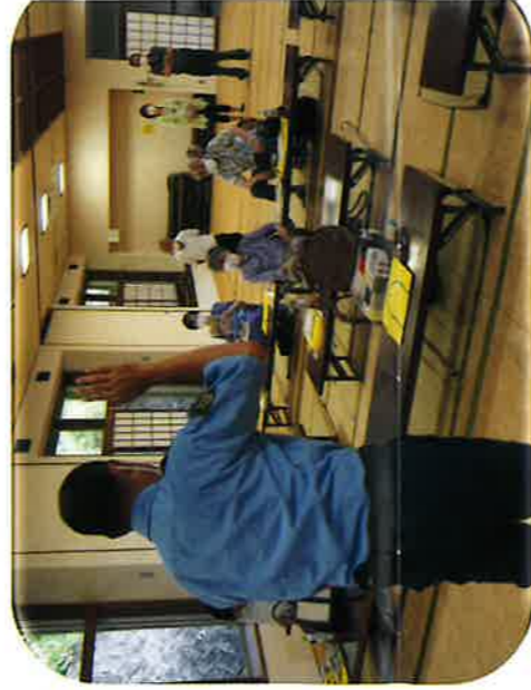
木更津警察署 交通事故と詐欺