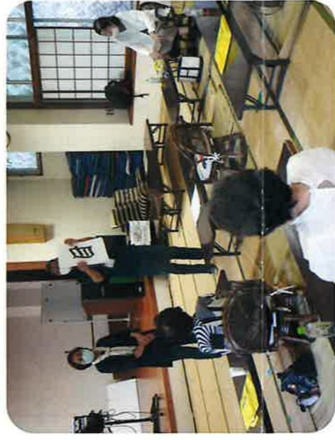
これな—んだ? なぞなぞ

令和3年6月15日老人福祉館で、お花見屋食会が開かれました。当日は、感染症対策を充分に行い、食事とともに「木更津警察署による交通事故防止、オレオレ詐欺防止の話」、「なぞなぞゲーム」、「尺八演奏」などを一緒に楽しみました。