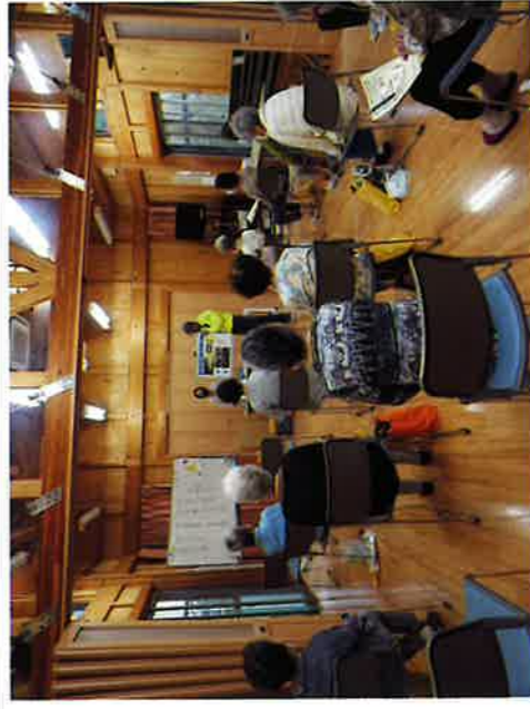
令和3年6月23日 浜宿自治会館 交通と防犯の話 薬剤師の薬の話