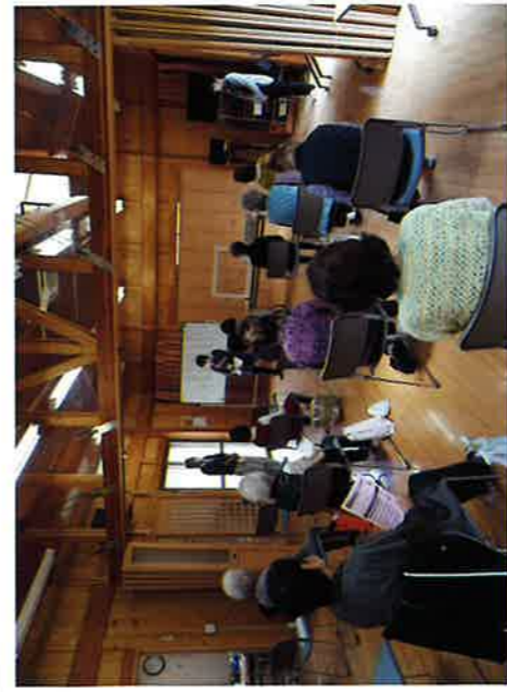
令和3年5月12日 浜宿自治会館 包括支援センター 体操と健康の話