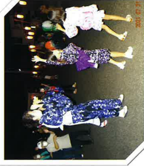
会館前広場 盆踊り