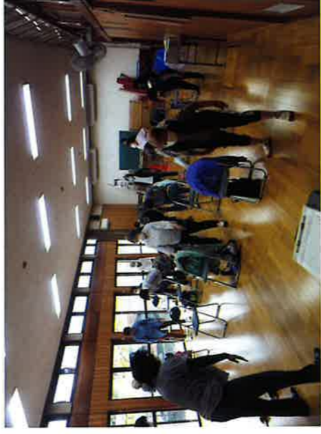
令和3年5月27日 久保田会館 包括支援センター 体操と健康の話