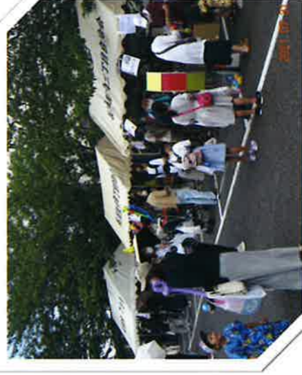
会館前広場 受付・その他