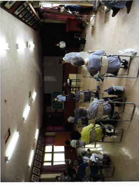
令和3年7月20日 代宿公民館 包括支援センター 体操と健康の話