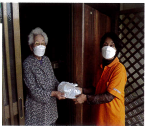
実際の訪問、手渡し