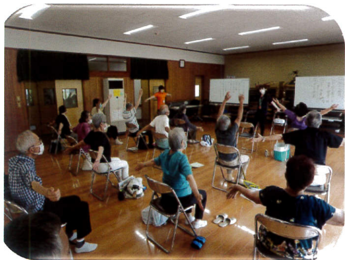
令和4年6月21日 体操と健康の話 長浦駅前自治会館