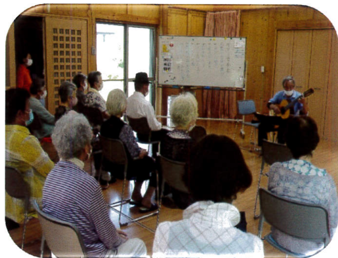
令和4年6月22日 ギター演奏 浜宿自治会館