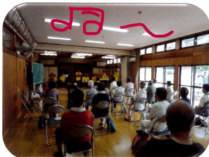
令和4年7月19日 オカリナ演奏 久保田会館