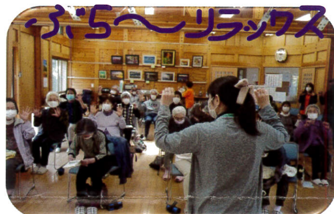
令和4年5月11日 体操と健康の話 浜宿自治会館