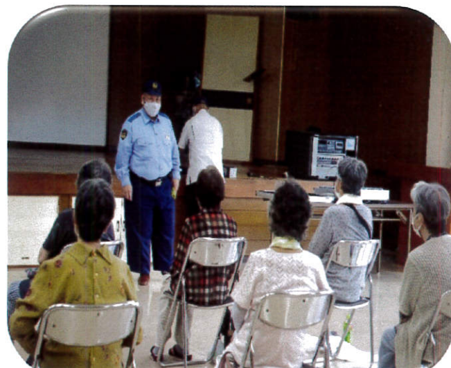
令和4年7月12日 交通と防犯の話 代宿会館