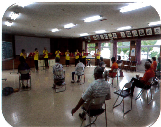
令和4年7月19日オカリナ演奏 代宿会館